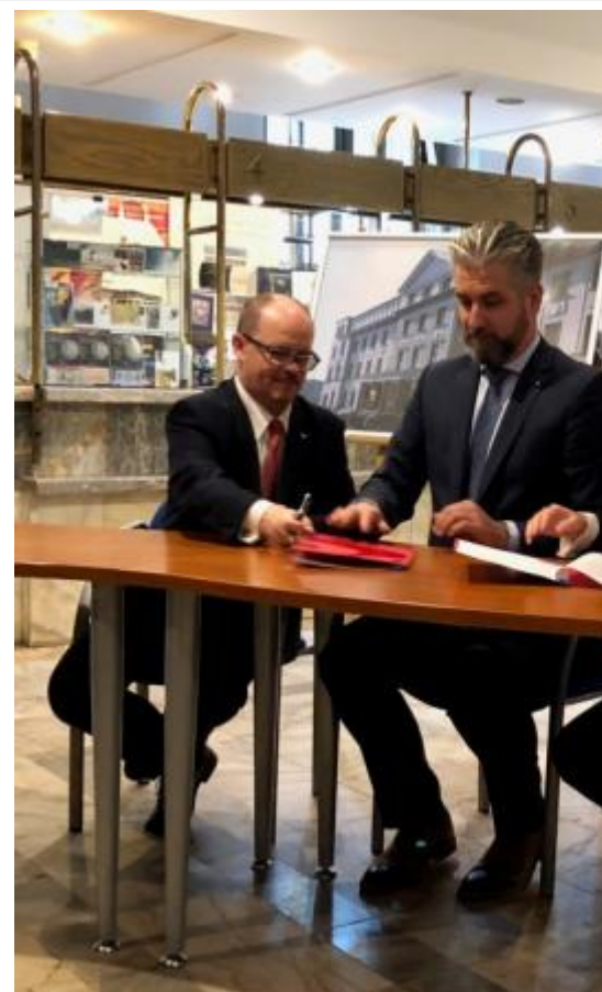
Budynek Poczty Polskiej Pocztowa 9 Katowice